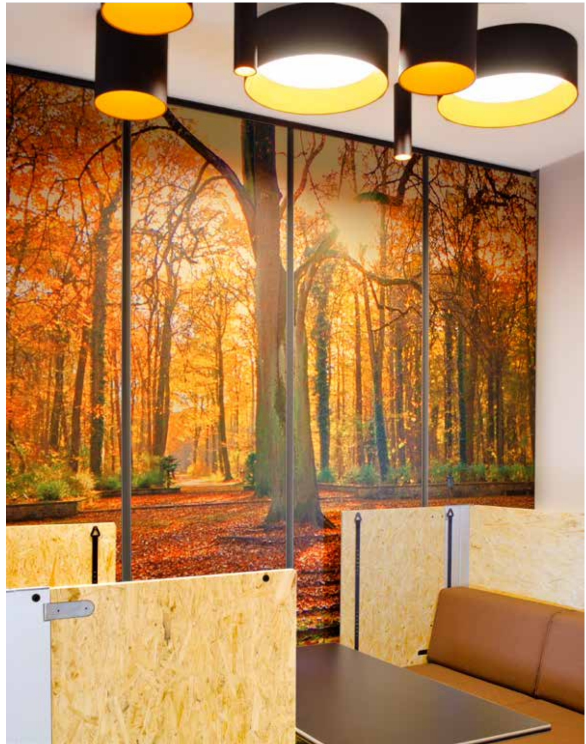
wall tex wetted