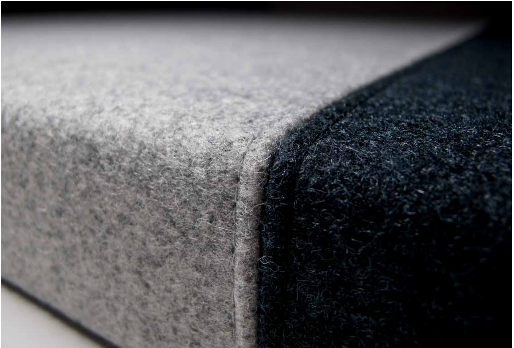
wall tex embraced