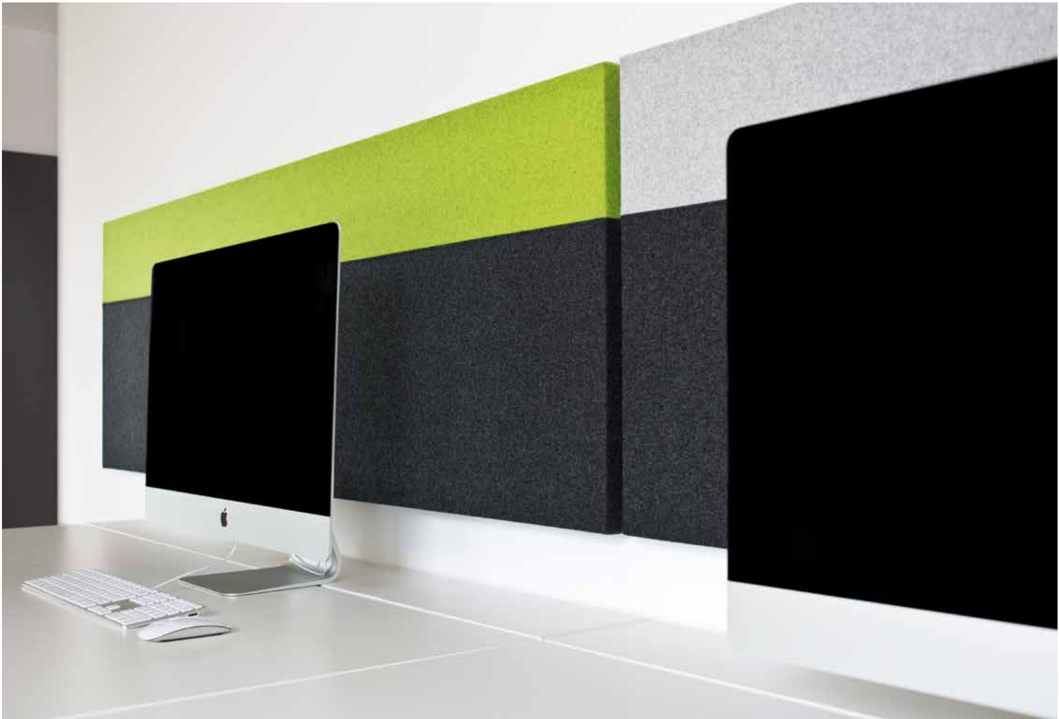
wall tex embraced