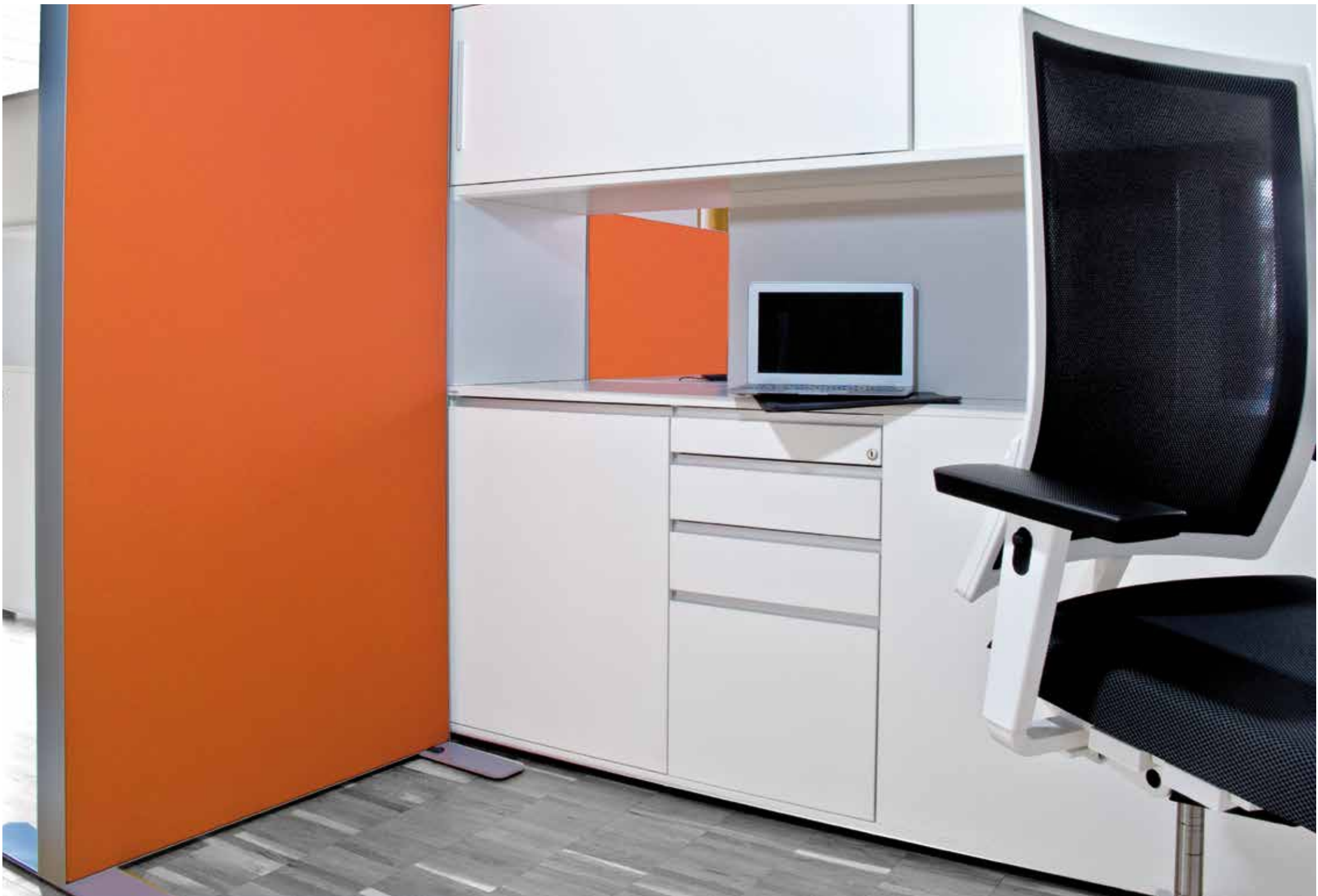
room tex welted