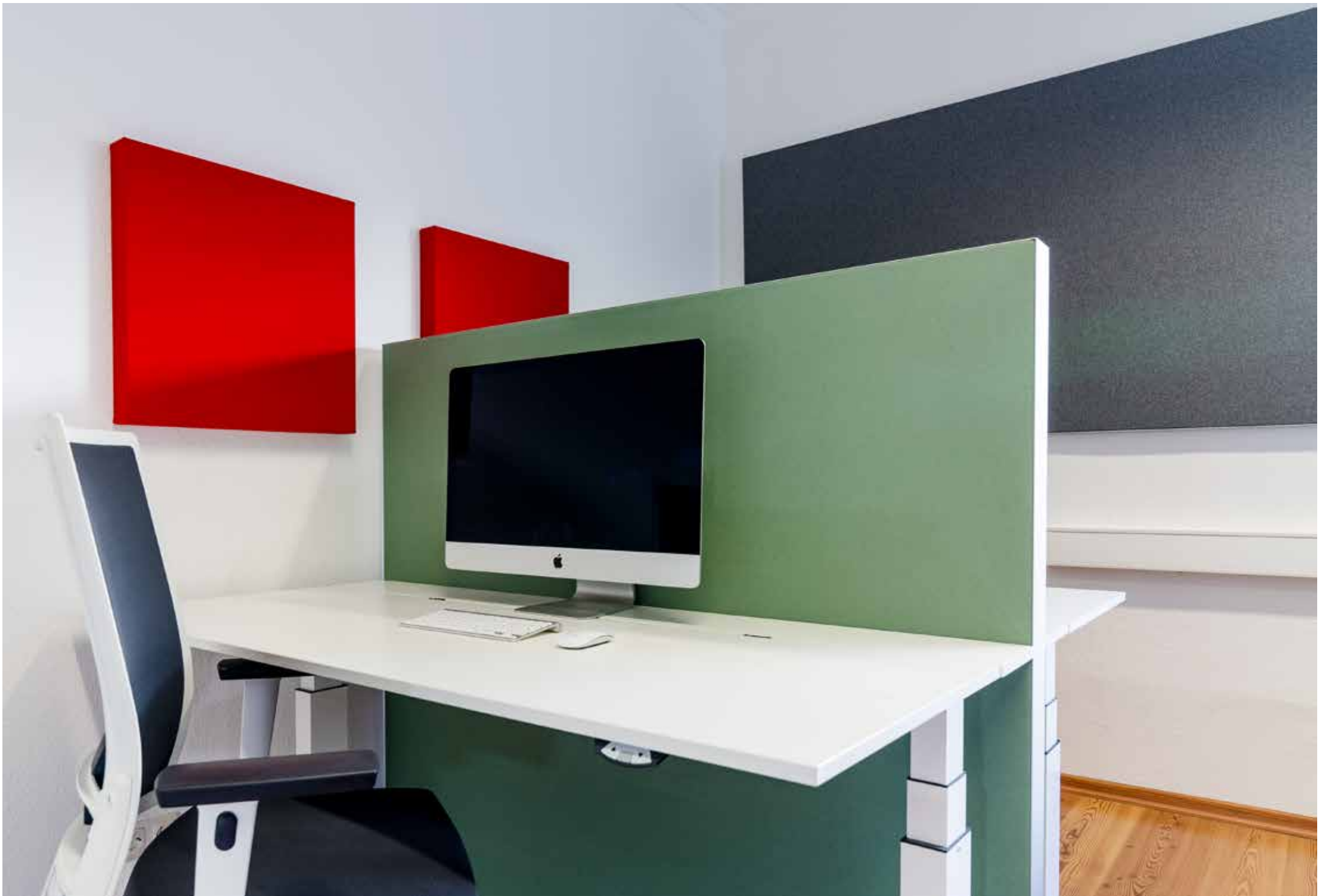
room tex welted