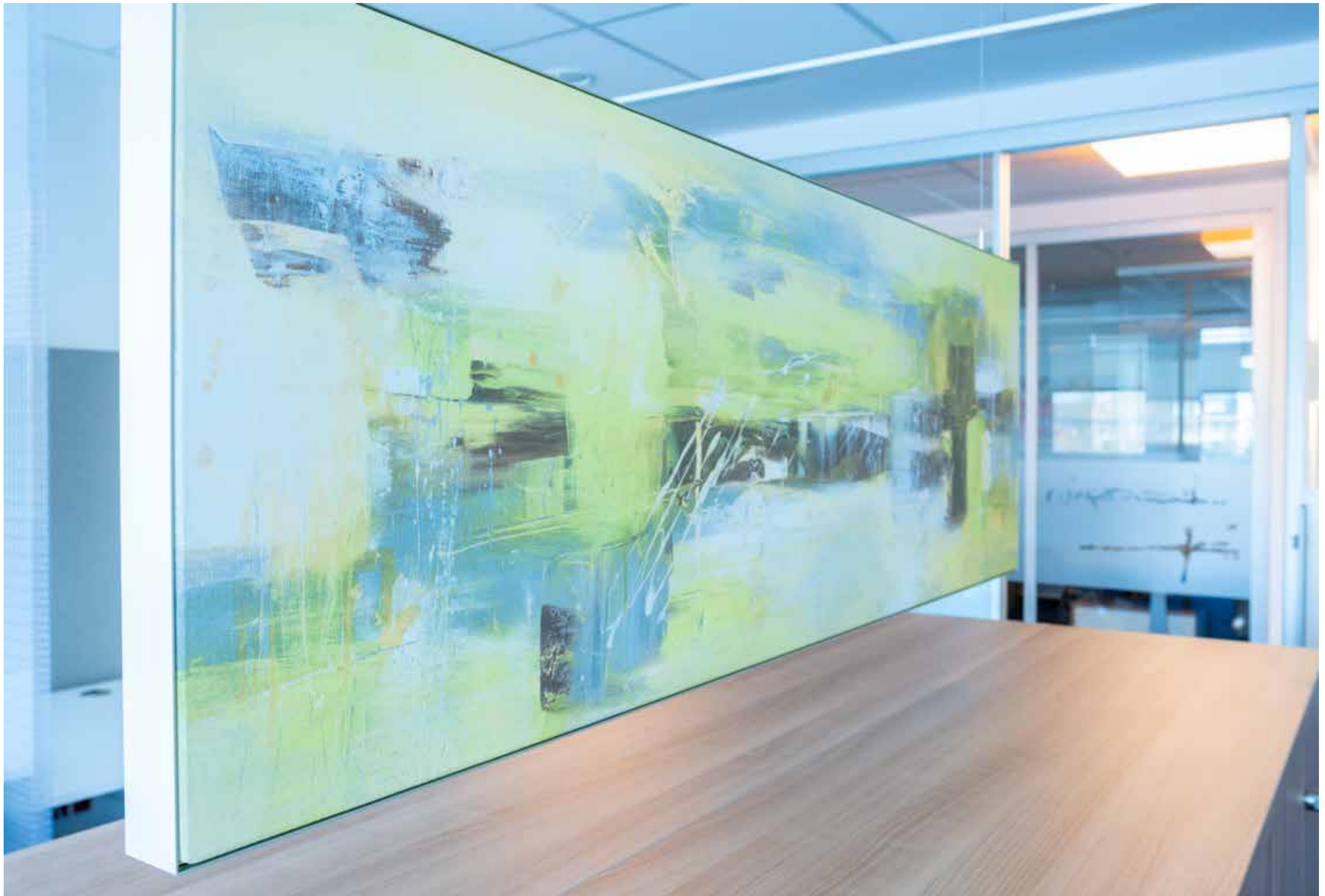
room tex welted