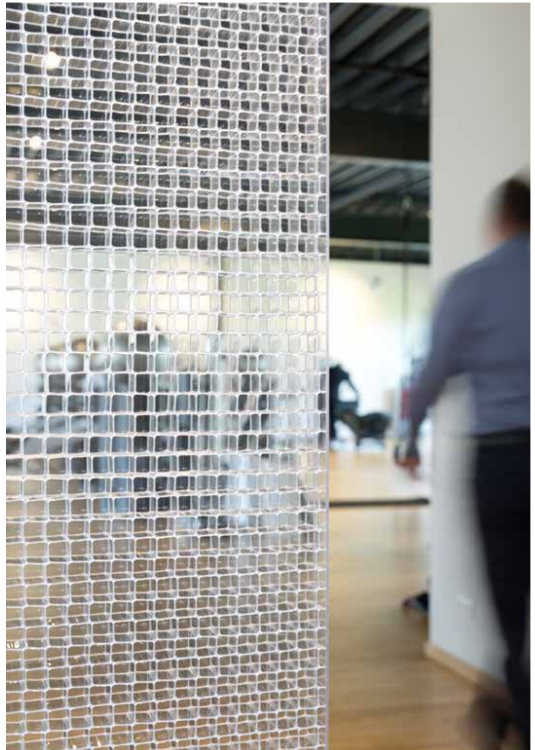
room tex cube