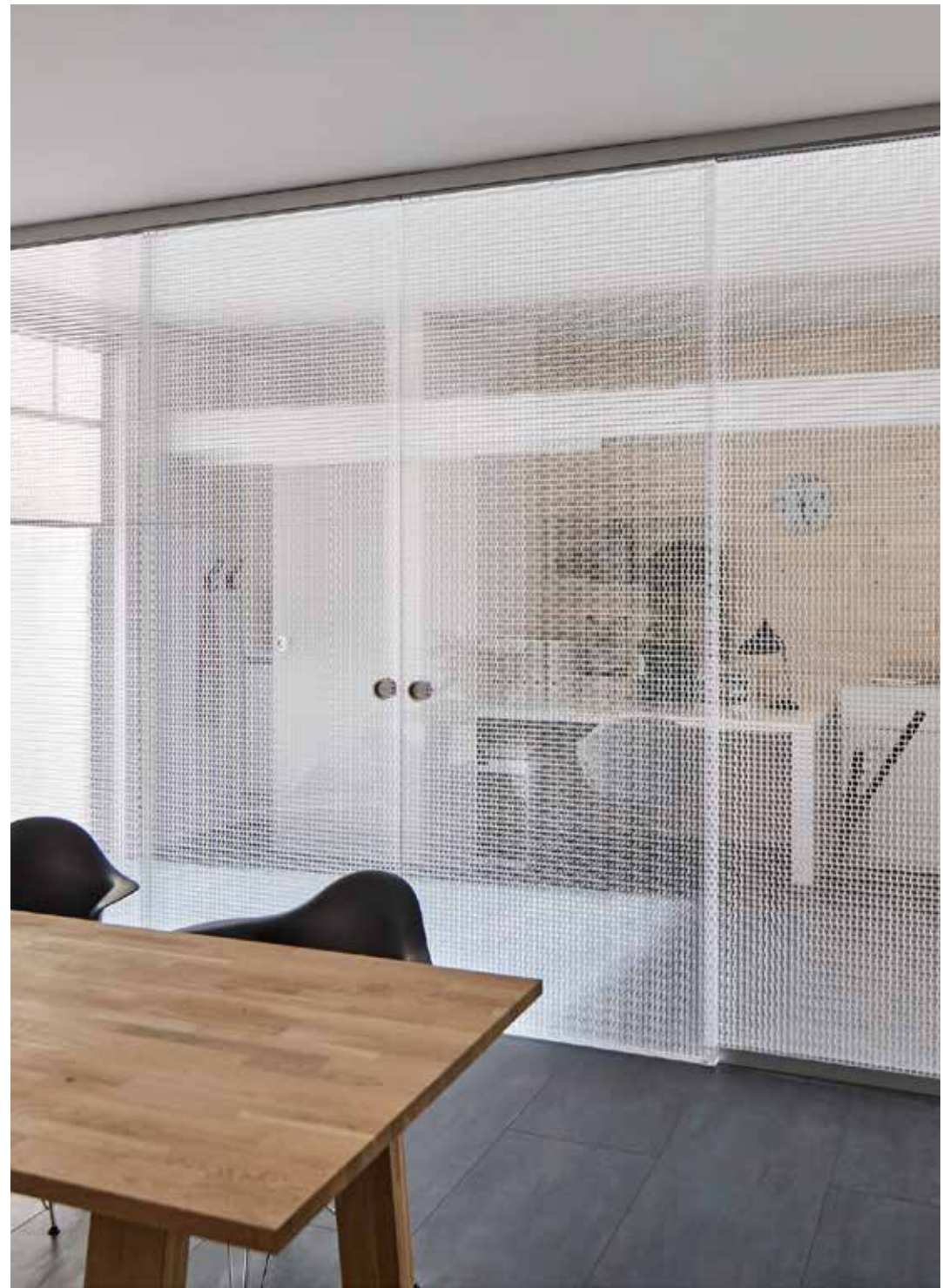
room tex cube als Schiebetür