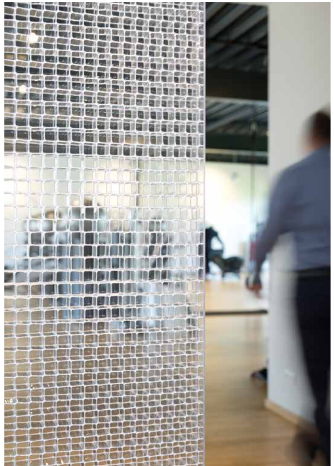
room tex cube