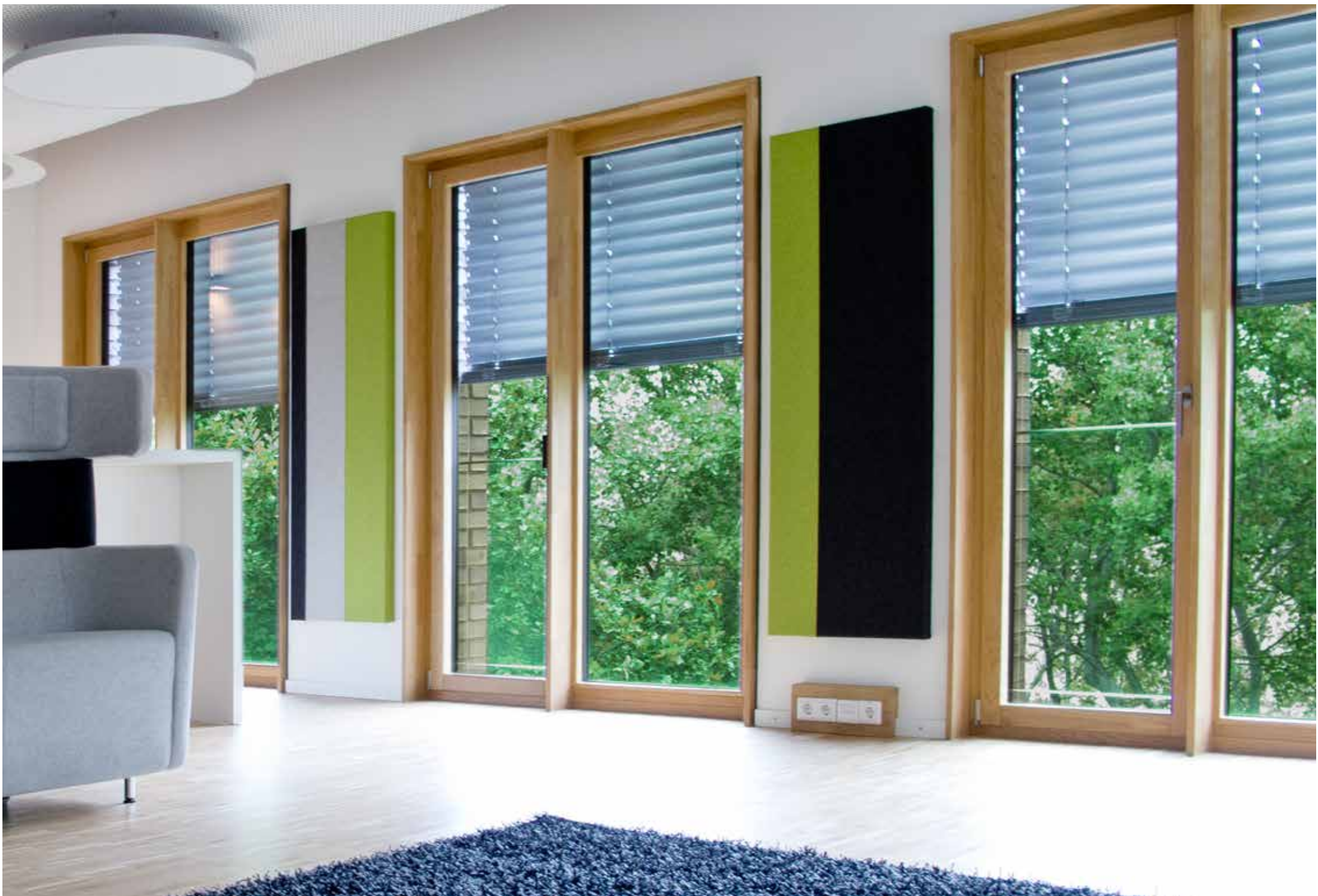
wall tex embraced