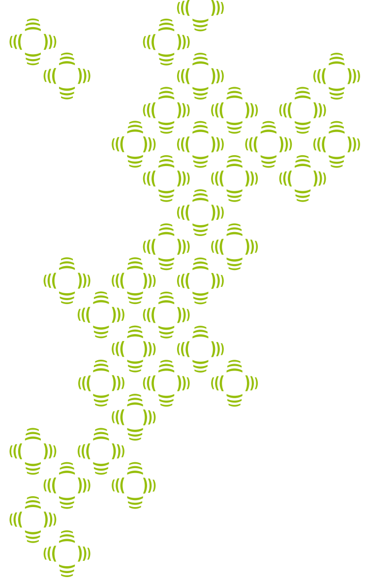
wall tex embraced