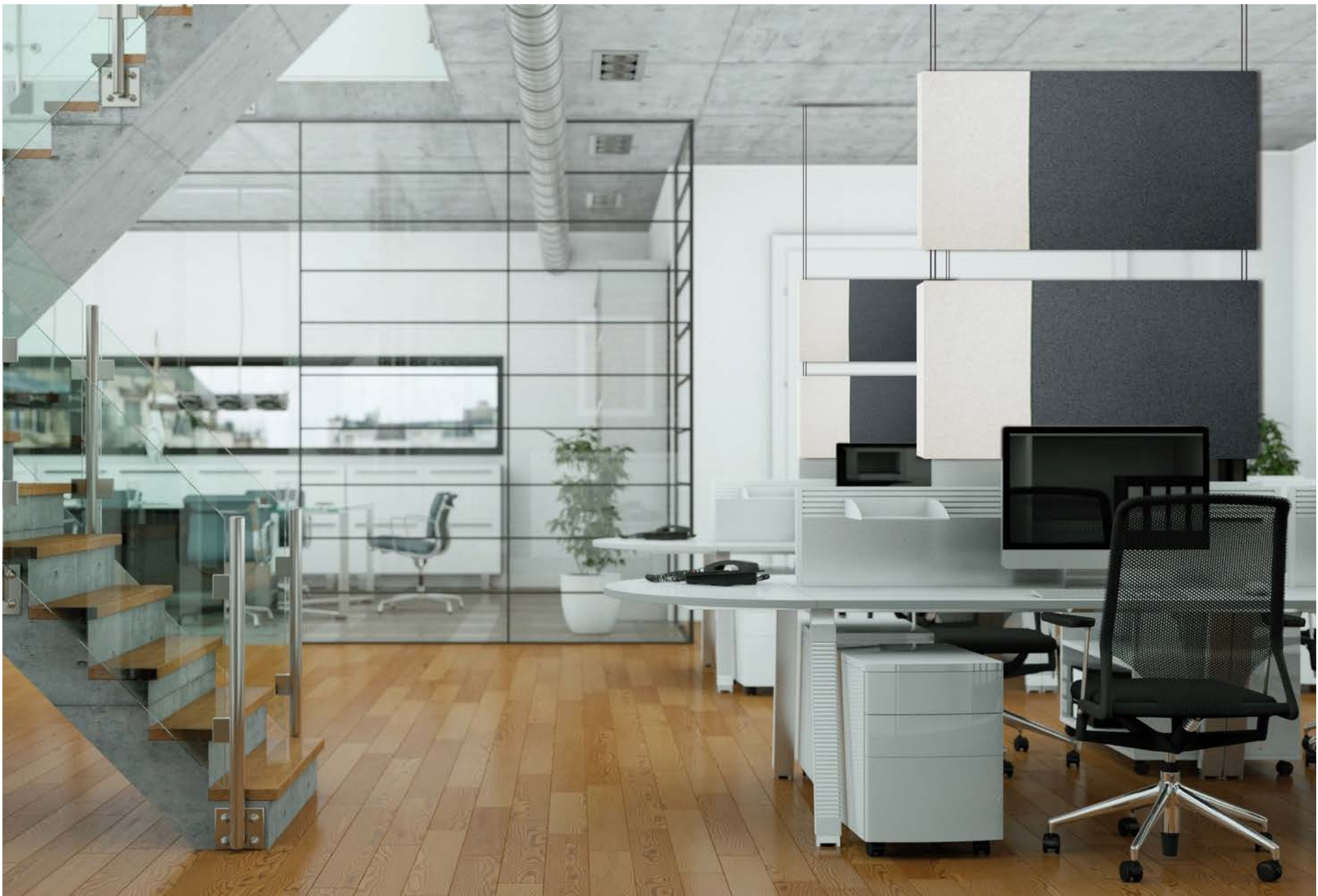
wall tex embraced