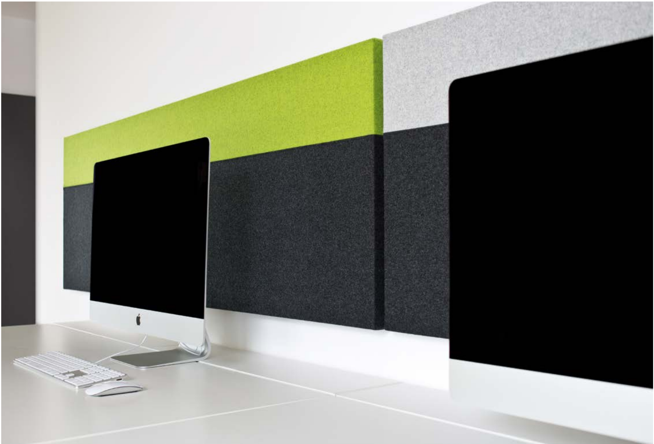
wall tex embraced