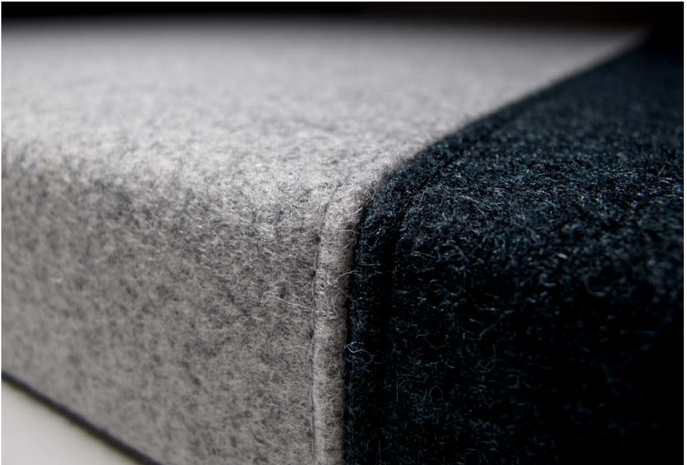
wall tex embraced