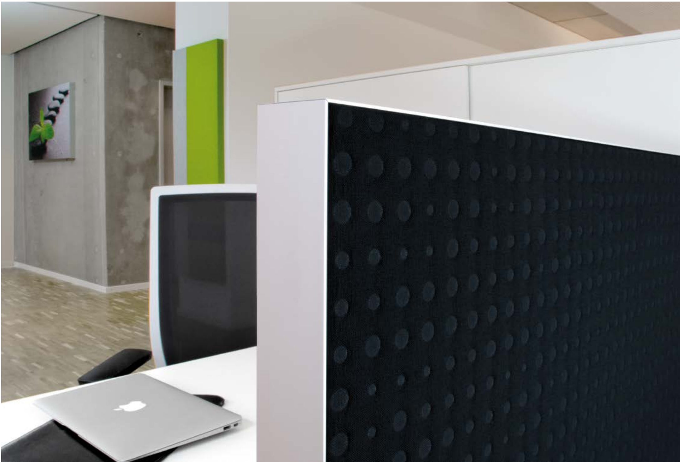
room tex table Tischabsorber