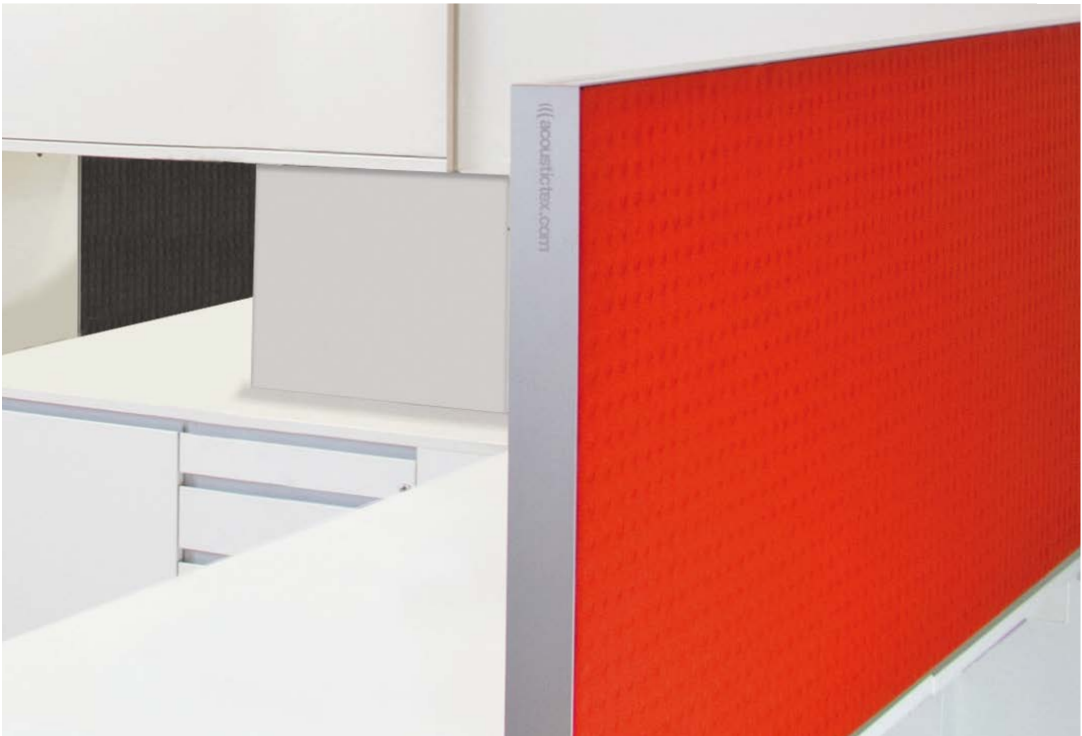
room tex table