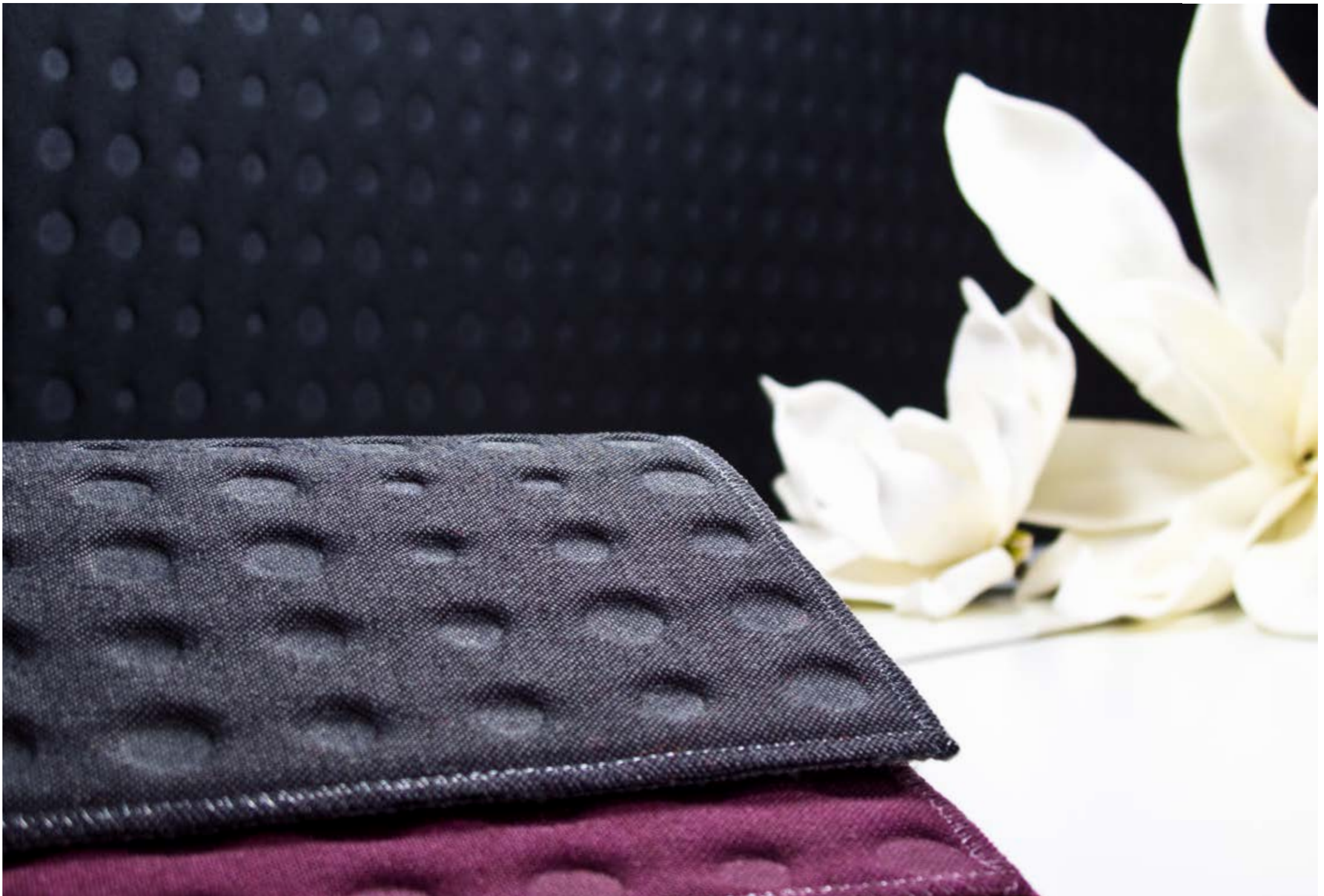
room tex table