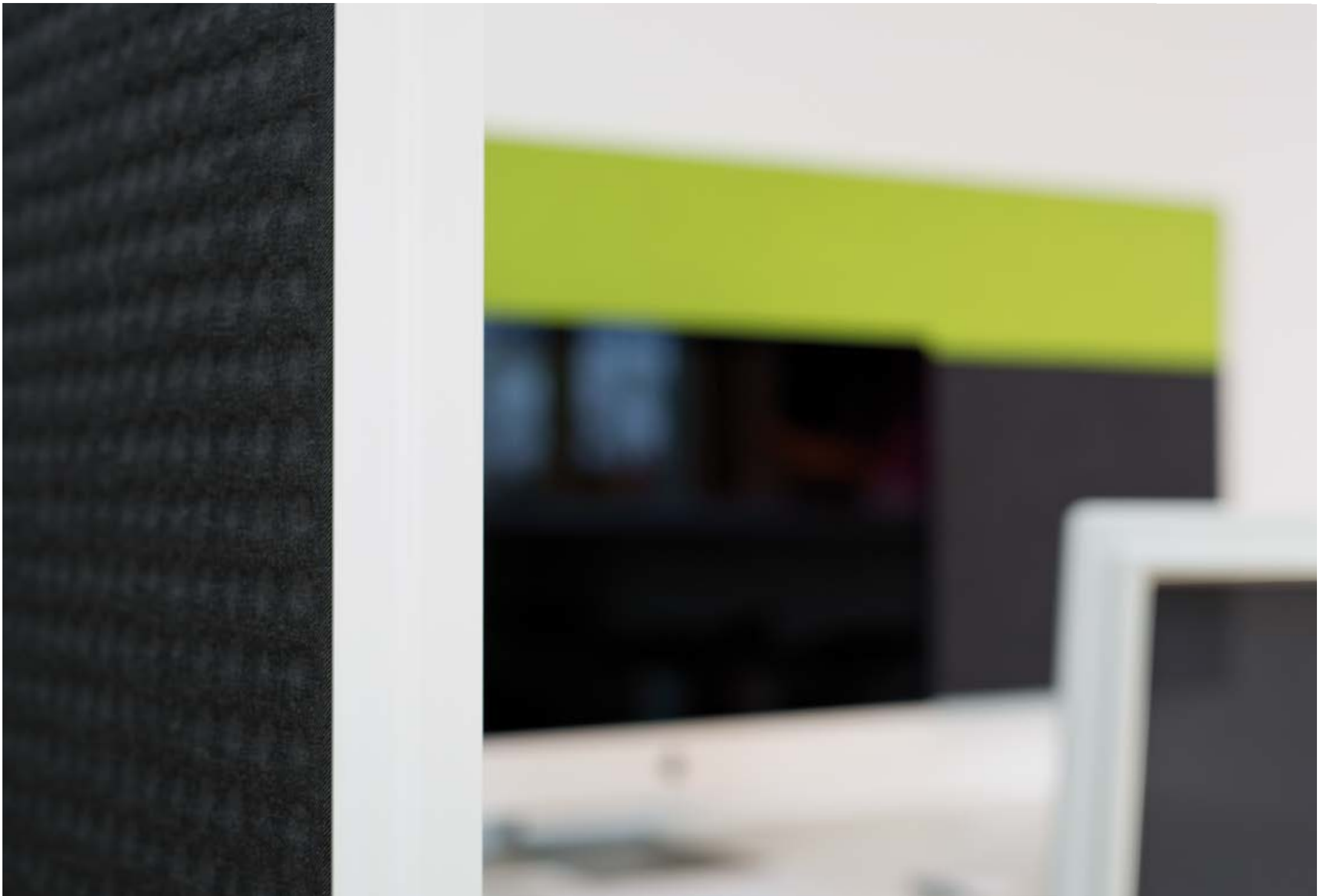
room tex table